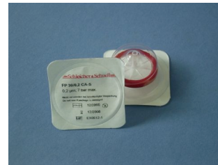
Einwegfilter 0,20 µm

Bakterienfiltration zur zusätzlichen Sicherheit. Die angesaugte Luft wird ebenso gefiltert.