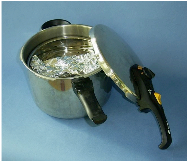
Sterilisation im Dampfkochtopf

Die sicherste Sterilisationsmethode mit vertretbarem Aufwand ist die Behandlung im Dampfkochtopf. Bei einem Überdruck von 1 bar /atü), geregelt durch ein Überdruckventil, herrscht eine Temperatur von ca. 120 Grad C. Nach einer effektiven Behandlungsdauer von 10 Minuten (aufheizen nicht eingerechnet) sind die eingelegten Teile steril.